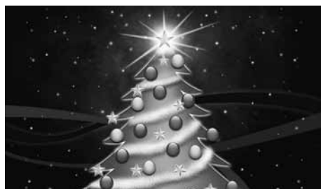
PERIÓDICO DE TABIO EL TORBELLINO LES DESEA UNA NAVIDAD EN PAZ Y UN PROSPERO AÑO NUEVO