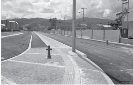
La nueva doble calzada a Gran Colombia cuenta con parque longitudinal, cicloruta y espacios peatonales.

infantiles, senderos peatonales y cicloruta. Los trabajos de construcción de la calzada norte han avanzado en un 99 %.