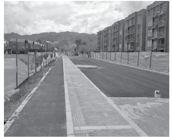
Vías con proyección que brindan mayores accesos y circulación vehicular